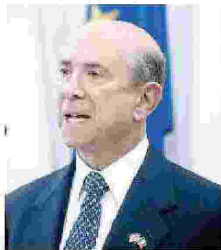
LEWIS EISENBERG AMBASCIATORE USA IN ITALIA