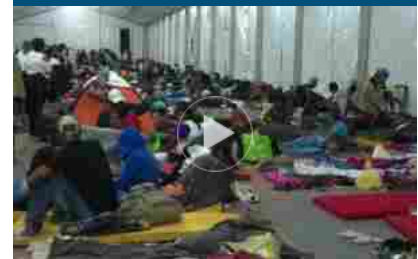
I migranti in marcia verso gli Usa: non siamo criminali