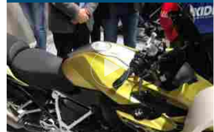
Bmw ad Eicma con 6 anteprime, spicca la supersportiva S 1000 RR