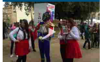
Lucca Comics & Games 2018: la carica dei cosplayer