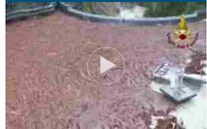
Maltempo, bellunese in ginocchio: le immagini della devastazione